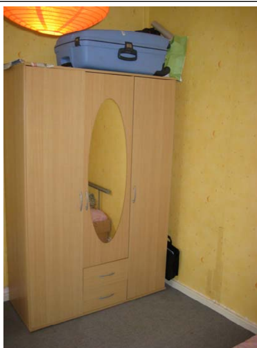
Wardrobe in Living room (1) – 衣柜