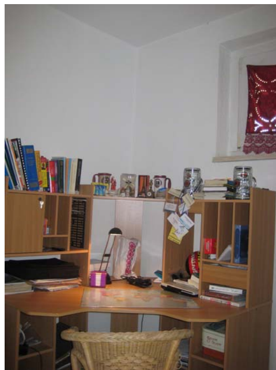
Computer desk & shelf – 书桌