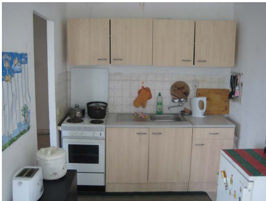
Kitchen - 厨房