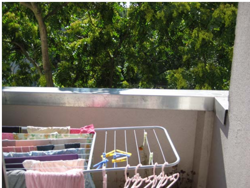
Balcony – 阳台