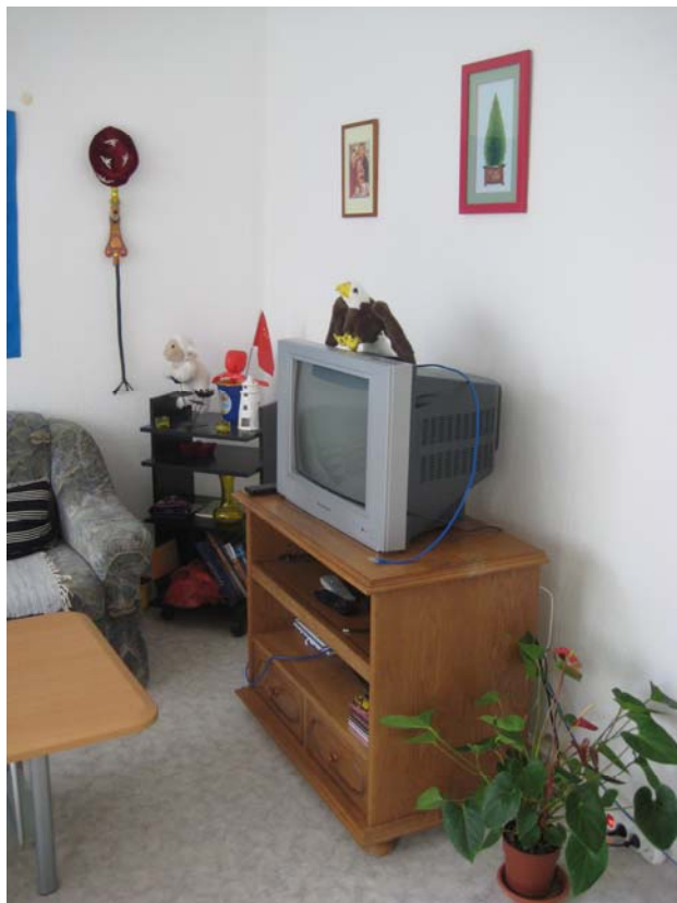
Living room TV set - 客厅

这是一套“两室一厅”的公寓，户主是 Halle GWG 公司，是对学生采取优惠政策，总面积 57 平米，月租费 310 欧元（含暖气费）。如果不是学生的话月租金大概在 360 欧元左右。