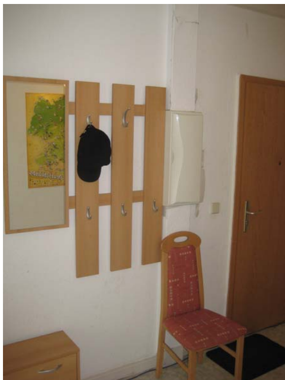
Main entrance – 正门