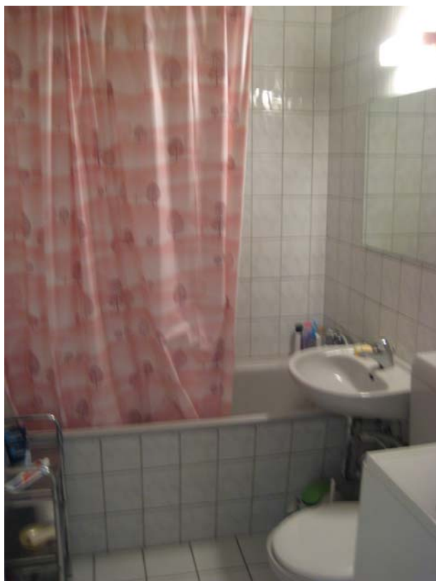
Toilet & bath room – 卫生间