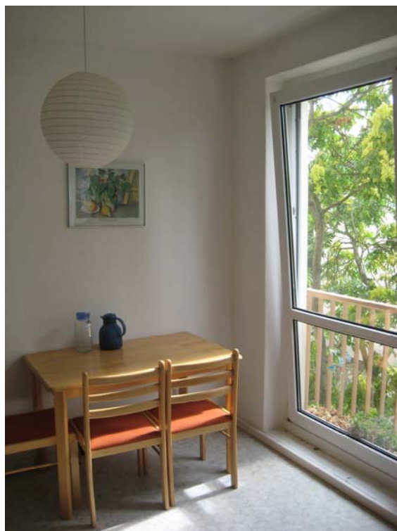
Dining place – 小餐厅