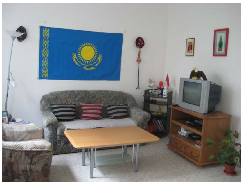
Over all view of living room – 客厅