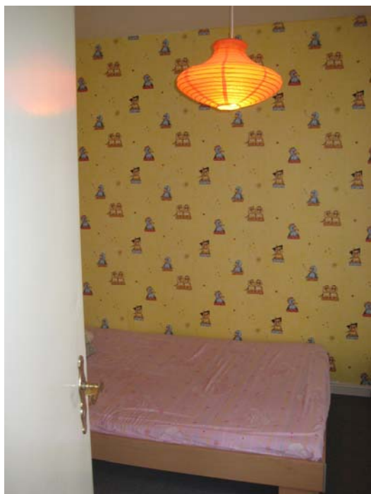
Bed room #1 - 卧室一