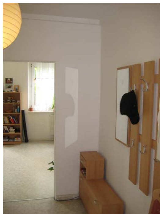
Living room direction - 客厅方向