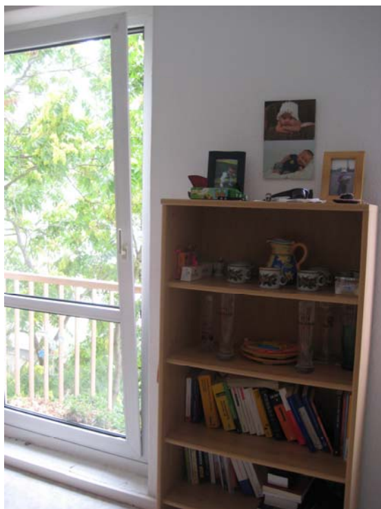
Bookshelf in Living room - 书架