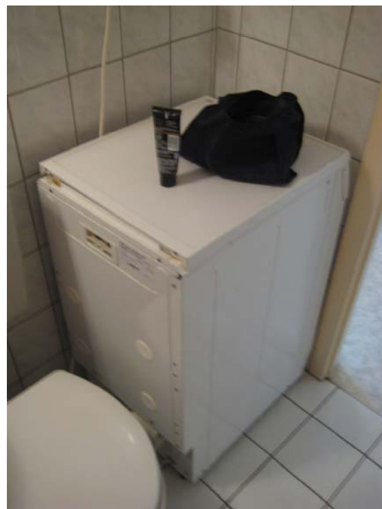
Washing machine - 洗衣机